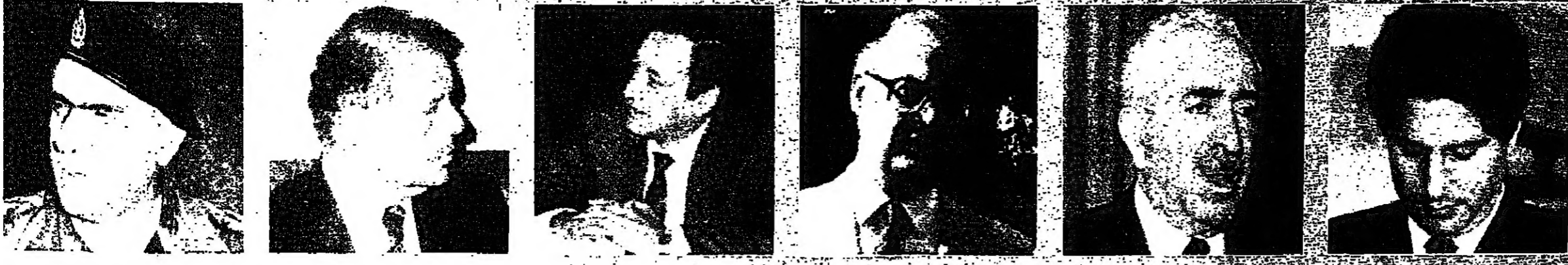
■ من اليمين إلى اليسار: وزير الدفاع الإسرائيلي، رئيس الوزراء الإسرائيلي، وزير الخارجية الإسرائيلي، وزير الدفاع الإسرائيلي، وزير الخارجية الإسرائيلي، وزير الدفاع الإسرائيلي، وزير الخارجية الإسرائيلي.